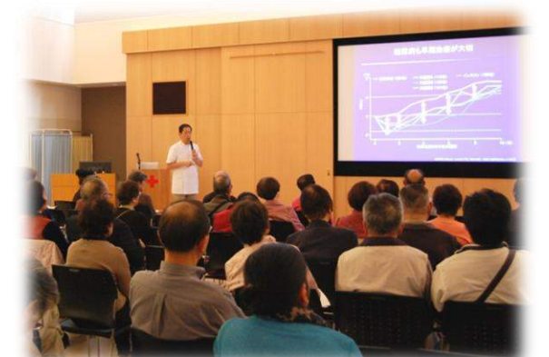
第2回 講演会の様子（糖尿病・内分泌内科 北里部長）