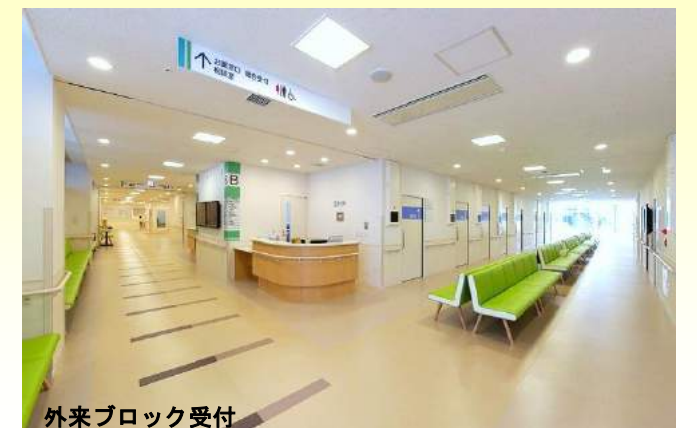
外来ブロック受付