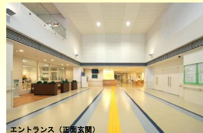
エントランス(正面玄関)