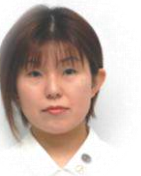
感染管理認定看護師