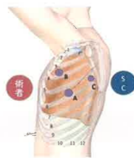
図1) 当科では3箇所ポート創を使用して胸腔鏡手術を行います。SC:スコピスト(カメラを操作する助手)