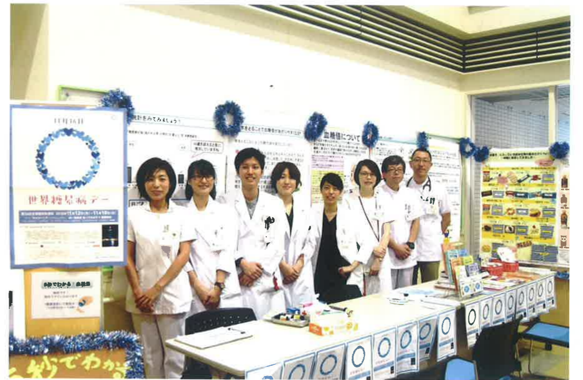
昨年度の世界糖尿病デーイベントの様子