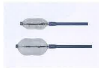
使用するバルーン

一言でいうと、つぶれた背骨を風船でふくらませてセメントで固める治療です。Kypho(カイフォ)というのは「後弯」という意味で、背中が丸くなること。Plasty(プラスティ)は、「形成する」という意味であり、BKPとは「Balloon(風船)を用いて、潰れた背骨を形成する。」ということです。