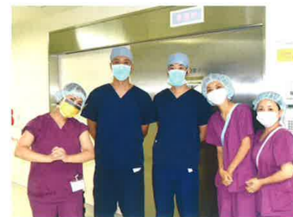
呼吸器外科チームとスタッフ

大森赤十字病院ではスタッフ一丸となって質の高い手術を提供できるよう頑張っています。健康診断の胸部レントゲンなどで異常を指摘されたり、胸の手術が必要と言われたら、ぜひ一度、当科にご相談ください。